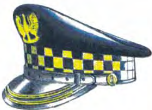
Rys. 3. Czapka służbowa z dwoma galonami dla komendanta i zastępcy komendanta