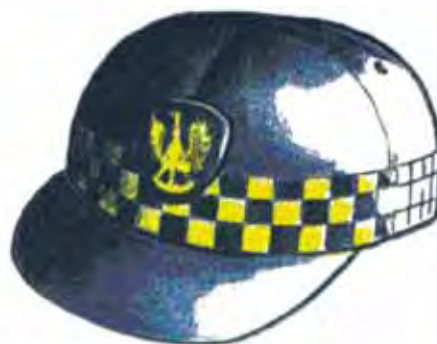
Rys. 5. Czapka typu sportowego