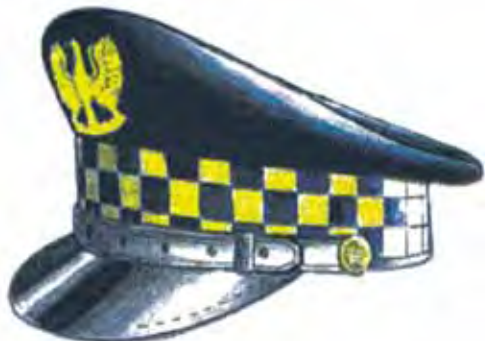
Rys. 1. Czapka służbowa okrągła dla inspektora, specjalisty, strażnika i aplikanta