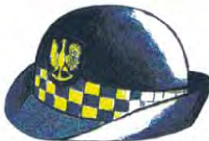
Rys. 4. Kapelusz damski