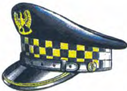
Rys. 2. Czapka służbowa okrągła z jednym galonem dla naczelnika, zastępcy naczelnika, kierownika i zastępcy kierownika