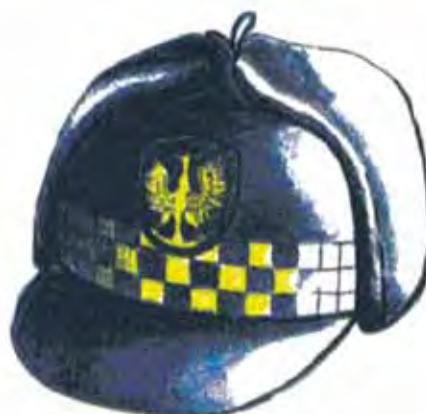
Rys. 6. Uszanka z daszkiem